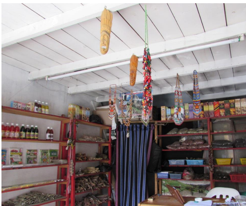
Imagen 8. Interior del lugar donde atiende uno de los especialistas en la magia.

cosas oscuras”. Como lo mostraba Taussig (2012), entre los indios sí hay los que hacen brujería. Los que hacen la magia son los que han estudiado libros de magia y cosas de satán. Incluso, como le decía una mujer indígena del Putumayo a Taussig, se piensa que son los blancos los que trabajan con tierras de cementerio y muertos (Taussig, 2012: 190). 52 O la gente negra, pues no fue una sino varias las versiones de que la gente negra del Patía, al occidente del departamento del Cauca, manejaban ese tipo de magia y que seguro grupos armados tanto legales como ilegales eran asiduos creyentes.