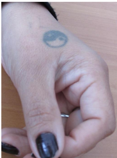
Imagen 11. Tatuaje de una de las excombatientes. Popayán, Cauca, noviembre de 2014