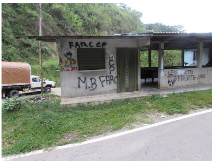
Imagen 6. Grafitits en la carretera, norte del Cauca. Diciembre de 2014

para aprender de este tipo de espacios y permitiéndonos acercarnos cada vez más crítica y propositivamente a los límites, problemas y disputas que nos encontramos a la hora de hacer campo; reconocer y entender aspectos como lo oculto, la sospecha, el miedo y la violencia pueden ser útiles en la producción de vínculos y en el entendimiento de lógicas muy importantes y poco reconocidas al