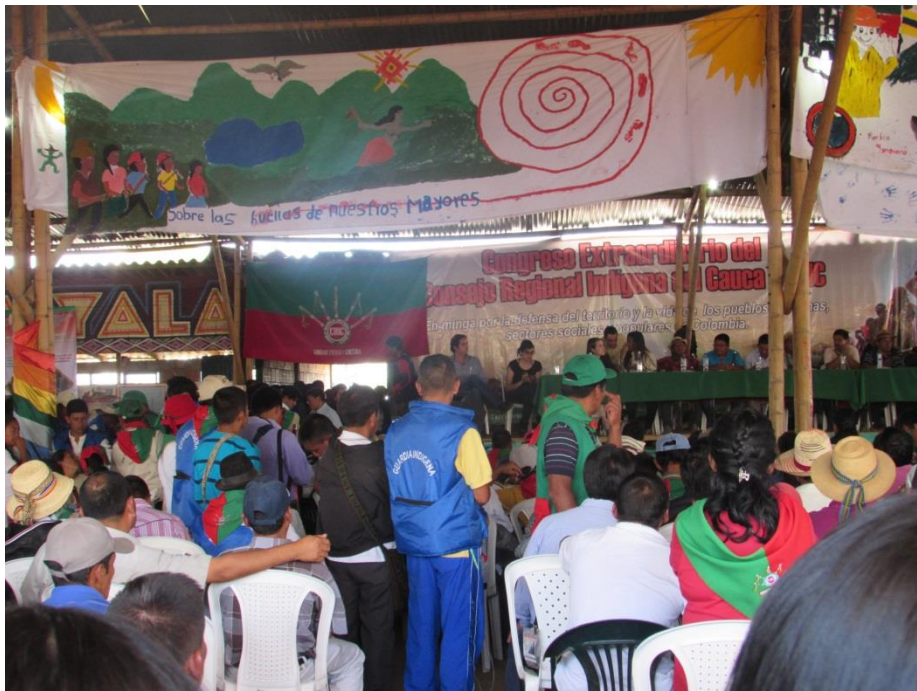
Imagen 5. "Sobre las huellas de nuestros mayores", Congreso Extraordinario de Pueblos Indígenas. Foto: archivo del autor, Piendamó, Cauca, octubre de 2014.