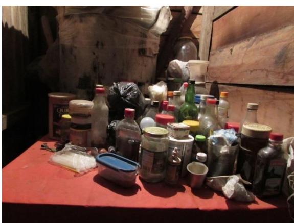
Imagen 14. Recipientes en el lugar de trabajo de doña Inés. Toribío, Cauca, diciembre de 2014

combatientes. Recordemos, como lo dijimos en el capítulo 2, que estos especialistas rituales, por el hecho de ser quienes son, de gozar entre la comunidad de un especial prestigio, conocidos por su sabiduría y experiencia, poseedores de misterios que otros no poseerían y, más aún, protagonistas de episodios fantásticos, están dotados de poder y representan una voz de credibilidad y confianza. No es de extrañar que la guerrilla, ávida de milicianos y combatientes, al igual que el ejército de informantes y de soldados, vea con recelo tales características en el médico.