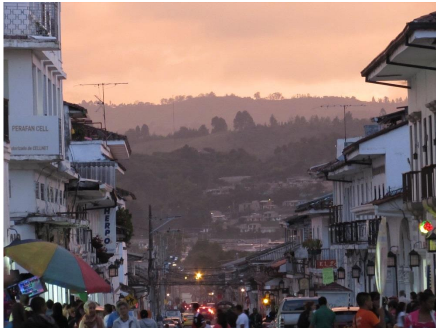
Imagen 1. Calle de Popayán. Octubre de 2015.

ciudad que dicen es más bien un “pueblo grande”, de espíritu conservador. Sin embargo es un paisaje multicolor; es un “lugar de tránsito o de asentamiento permanente de familias procedentes del área rural. Frente a estos cambios, es claro que el imaginario basado en la idea de ‘Ciudad Blanca’ es insostenible. La presencia de ‘otros’ en la urbe rompe este esquema estigmatizador” (Tocancipá, 2014: 44). Estos otros, como los brujos y chamanes indígenas provenientes de otros lados, y que me encontré, precisamente, cerca al centro de esta ciudad.