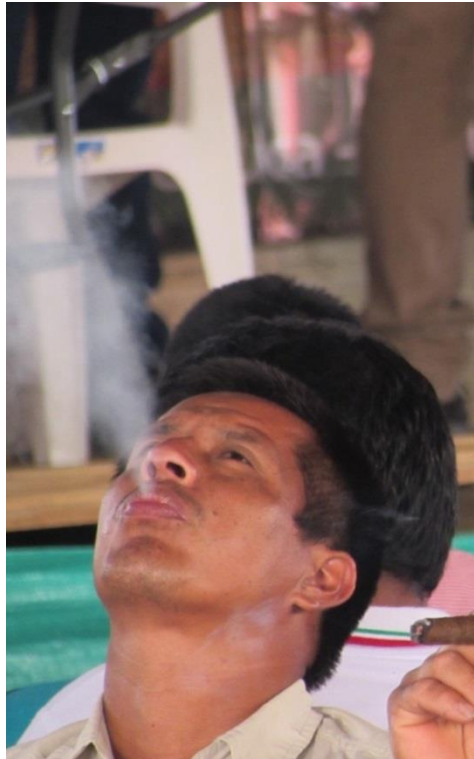
Imagen 3 y 4. Mayora y mayor fumando junto a la tulpa (fogón), Congreso Extraordinario de Pueblos Indígenas. Piendamó, Cauca, octubre de 2014.