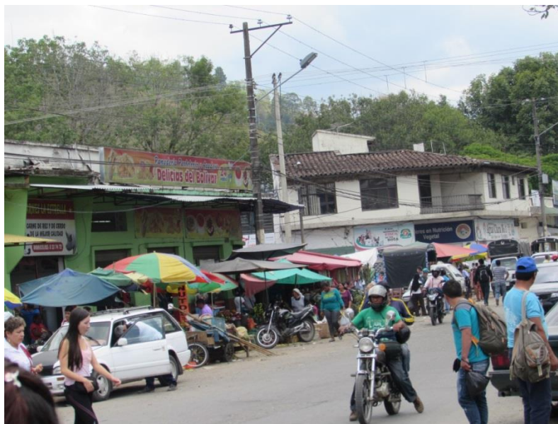
Imagen 2. Barrio Bolívar, cerca al centro. Popayán, Cauca, octubre de 2014

Entonces, de todo lo dicho más arriba había una enseñanza: este trabajo de campo debía tener muy en cuenta ese sistema de sospecha y precaución que relacionaba el mundo de la guerra y la magia; la gente vive su vida, intentando cambiar la “mala suerte”, la tragedia, e insiste en la sospecha y la cautela como una mimesis necesaria. Por ejemplo, en una población de alta dominación guerrillera, cualquiera con el que hablara yo, alguien de una moto, a los que me veían pasar mientras caminaba, podrían ser milicianos. 23 Sabía que me observaban, así que era menester la desconfianza; la gran mayoría de las veces informaba a alguien conocido de dónde iba a estar. También, En Popayán, si bien había cierta “seguridad” al realizar mis entrevistas en la ACR, al principio siempre fui sospechoso, un desconocido más para excombatientes: me preguntaban “para qué es ese trabajo”, “¿mi nombre va a salir?”, “¿va a grabar?”. Sumado al hecho de que, por ejemplo, algunos paramilitares no quisieron hablar o se limitaron a responder “sí”, “no”. Después de su desmovilización, todavía hoy se cuidan de las preguntas de los otros como yo, aun cuando las preguntas fuesen diferentes a las que hacía el programa gubernamental