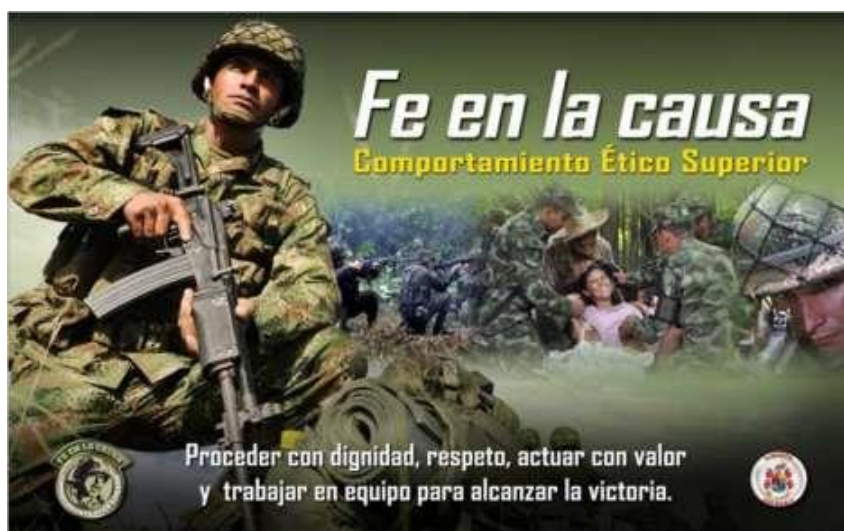
Imagen 10. “Fe en la causa”, campaña de las Fuerzas Militares de Colombia. Ilustración extraída de la página web oficial del Ejército Nacional de Colombia. Marzo de 2015.