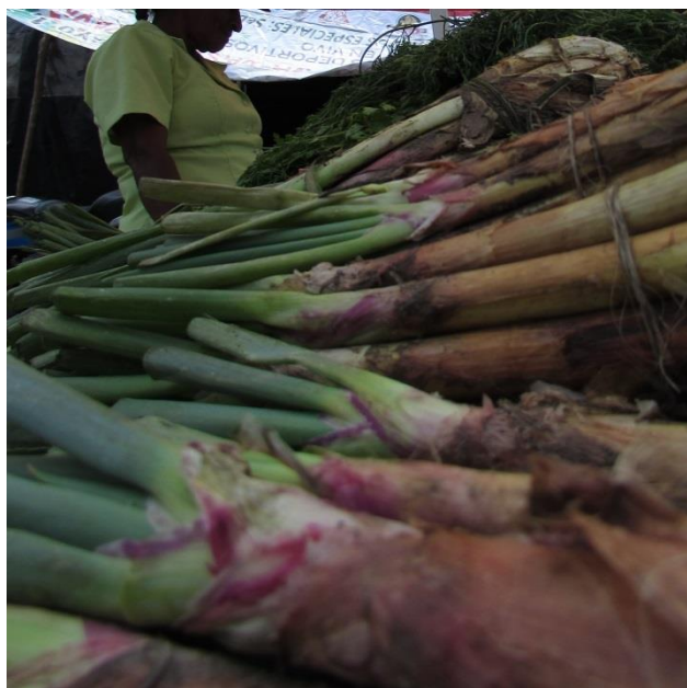
Imagen 13. Doña Susana en el mercado. Toribío, Cauca, septiembre de 2014

por estos asesinatos y aprovechando el conocimiento que tienen del territorio, entre varios indígenas lograron cercar a quienes habían cometido tal hecho y sin varios guerrilleros de origen Nasa. 137 Todo ello pasaba mientras yo buscaba las entrevistas correspondientes. Y esto es importante para tenerlo siempre como fondo de las narrativas de las autoridades, médicos tradicionales y otros personajes que con su narrativa nos ilustran el impacto de la magia, “del secreto”, para así protegerse de la misma guerra que, como vimos, también se adhiere a las certidumbres que ofrece los misterios de la magia.