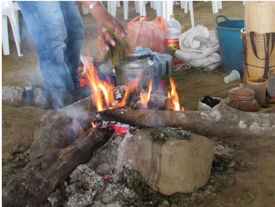
Imagen 12. El fuego y la ofrenda con hojas de coca. Congreso Extraordinario de Pueblos Indígenas.

Toribío, Caldon o Tacueyó. Piara este último momento me fue indispensable contar con algunas personas conocidas, quienes me pusieron en contacto con estos y estas chamanes Nasa. De no ser así hubiese sido más difícil e incluso