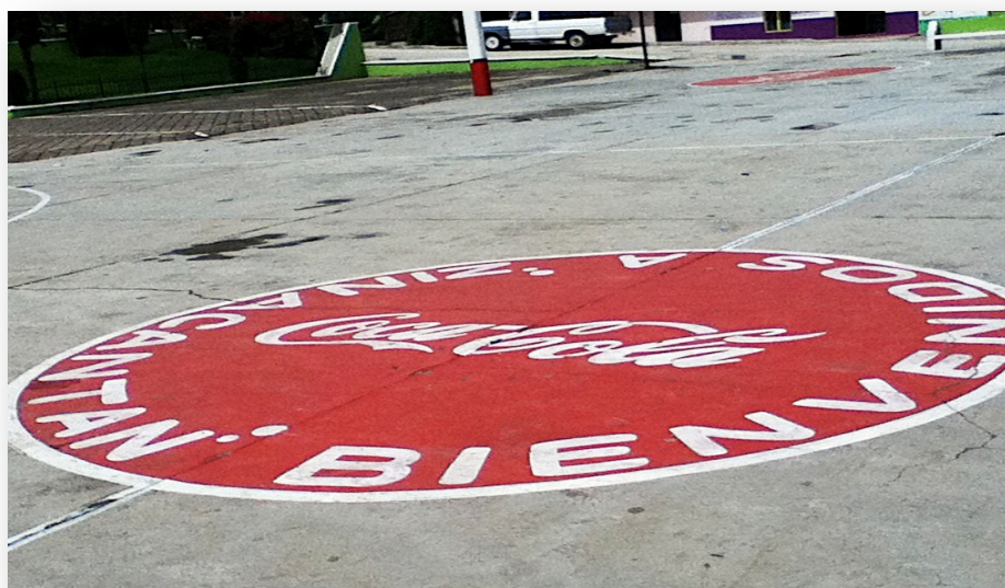
FOTO 4. En la explanada del palacio municipal.