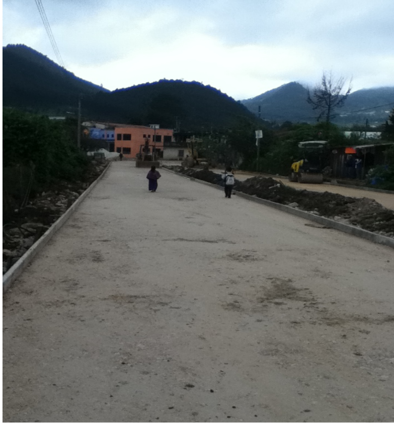
FOTO 1. Calle en proceso de pavimentación, septiembre 2011.

Hoy por hoy la cabecera municipal sigue siendo el lugar en donde los sucesos más importantes se llevan a cabo desde actividades económicas hasta las políticas. Es un lugar relevante también en el sentido religioso porque representa el “centro ceremonial”. Aquí diariamente se puede disfrutar del silencio y la calma habituales, ya sea un día soleado o con lluvia la quietud que se observa en sus calles es constante. Si bien se observa a la gente transitando y realizando sus actividades cotidianas, la calma se mantiene sobre todo cuando cae la noche.