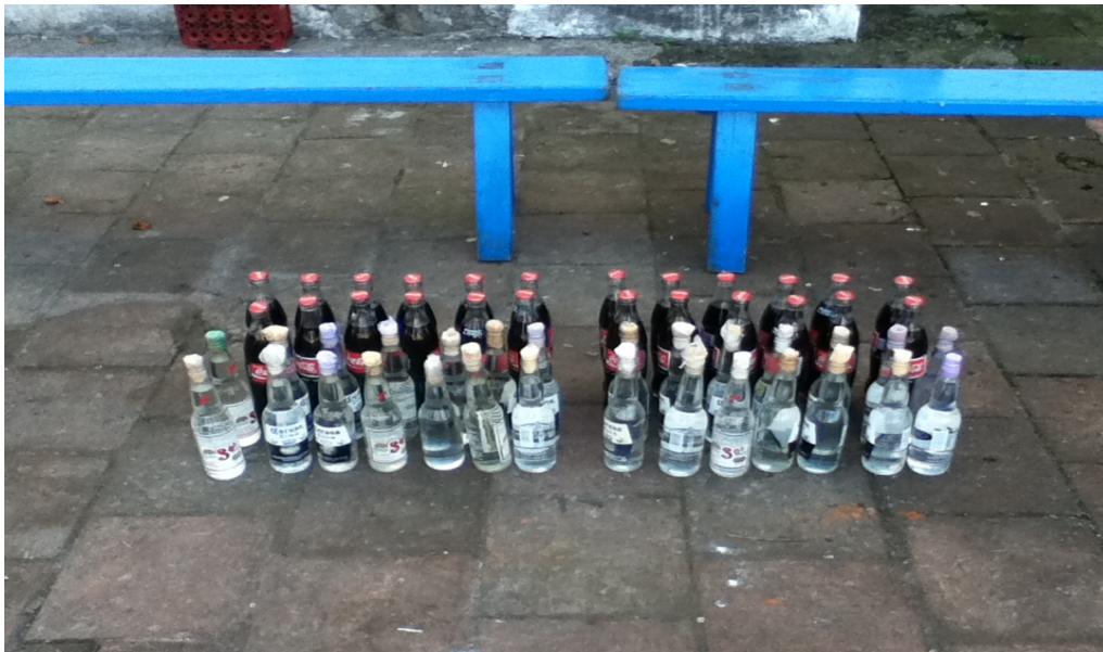
FOTO 2. Bebidas que se ofrecen a los varones con cargo, durante las celebraciones religiosas.

“Toda comunicación o transacción importante entre las personas va acompañado de la ingesta de alcohol, las transacciones entre los hombres y lo sobrenatural deben de ir acompañados por este aguardiente” (Vogt, 1973:31).