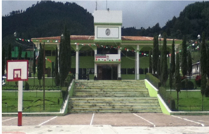
FOTO 5. Promoción de la empresa refresquera en las instalaciones del palacio municipal de Zinacantán.

Hoy en día en los Altos el consumo de estas bebidas se ha convertido en un producto “básico”. En cualquier tienda de abarrotes de la cabecera se puede comprar este tipo de refresco y cuando alguien se le invita a conversar, a comer se ofrece refresco en primera y a veces como única opción. Más aún cuando se trata de algún evento festivo o religioso donde se les ofrece un refresco completo de 1 lt a cada persona.