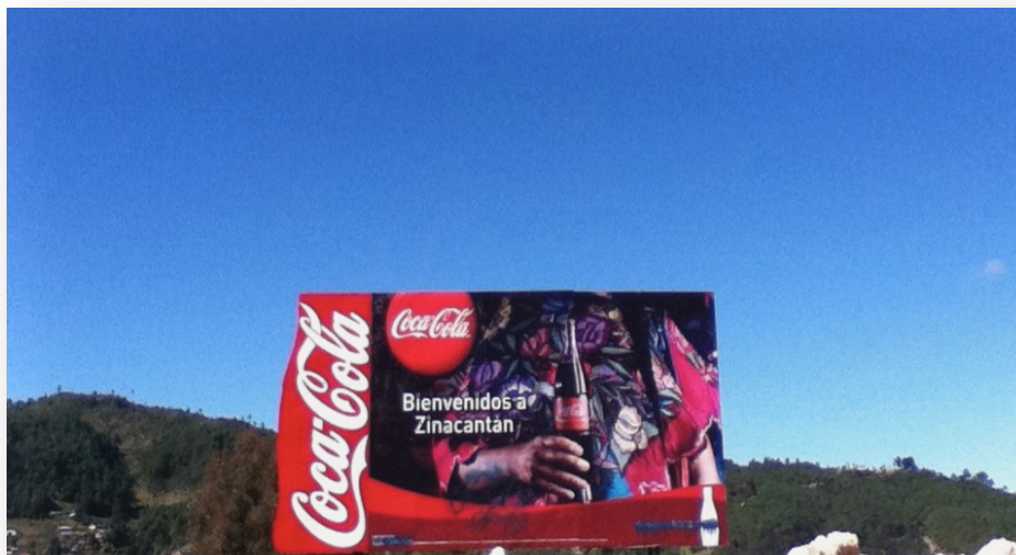
FOTO 3. Espectacular colocado a la entrada de la cabecera municipal de Zinacantán.

En las canchas deportivas que están justo al frente del Palacio Municipal también se observa en los pisos promocionales pintados de la marca, ya que “aparte de patrocinar equipos, la embotelladora también suele patrocinar espacios deportivos. Normalmente, esto consiste en la pintura de canchas o tableros con los colores y logotipos de alguna de las tres marcas principales de Coca-Cola: Sprite, Fanta o Coca-Cola.” (Jordan, 2008:137).