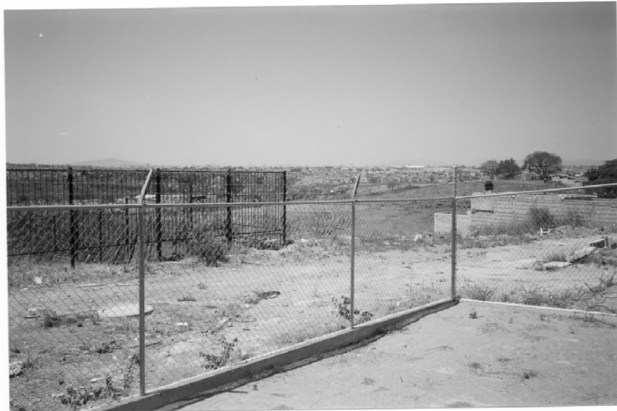
Parte posterior del CAI