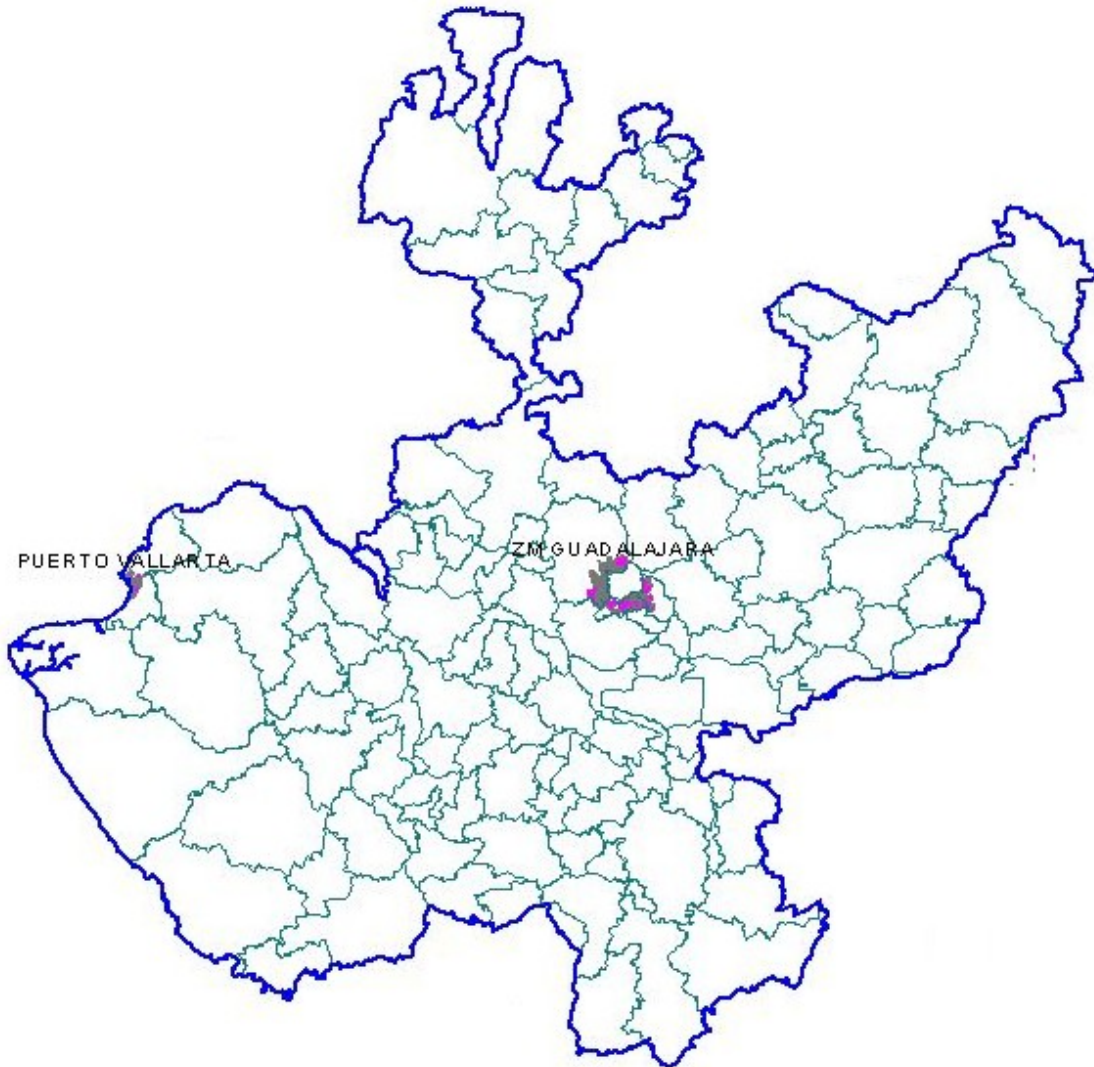
Mapa de la influencia del Programa Hábitat. Fuente: Sedesol 2002.