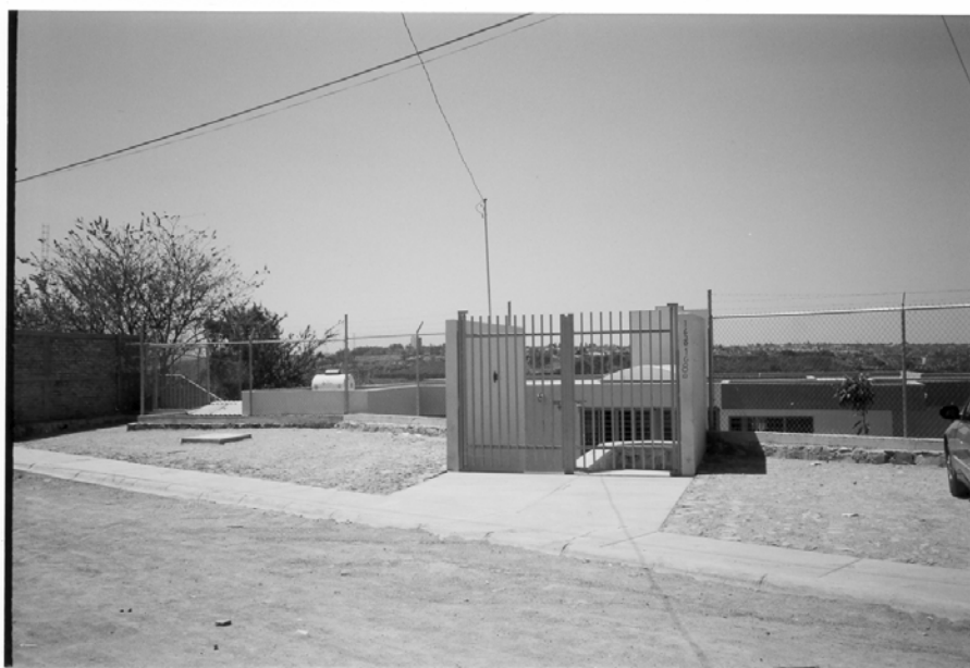
Frente del CAIC de la colonia La Coronilla antes de la inundación

A continuación mostramos una foto de cómo lucía el CAIC antes y la modificación que hicieron en la construcción después del desastre.