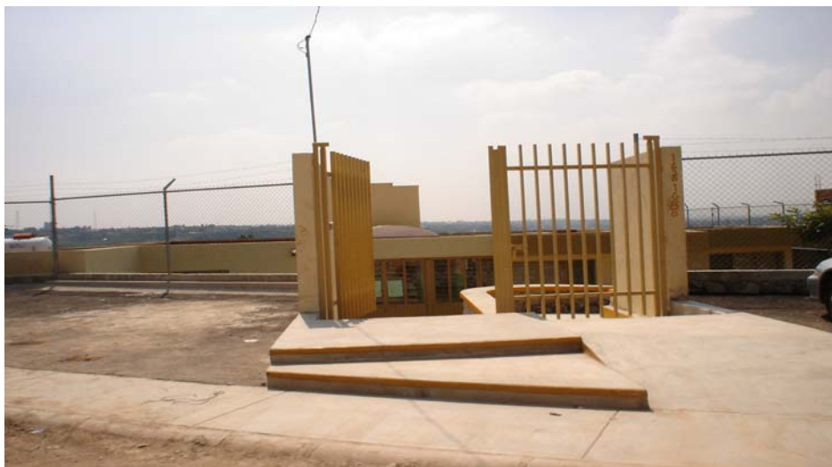
Modificaciones al frente para evitar una nueva inundación.

Este siniestro hizo que las autoridades municipales realizaron algunas modificaciones a la entrada, poniendo un batiente de contención más alto, así como un drenaje más amplio para desaguar más rápido en caso de que volviera a suceder un desastre de esa naturaleza, que no sólo causó pérdidas en la infraestructura, porque tuvieron que volver a pintar todo el edificio y hacer una limpieza profunda por la inundación de los sanitarios, sino que también perdieron alimentos como leche, jugos y cereales que eran fundamentales para la operación del centro, porque se encontraban en una bodega en bajo nivel que se inundó igual que todo el CAIC.