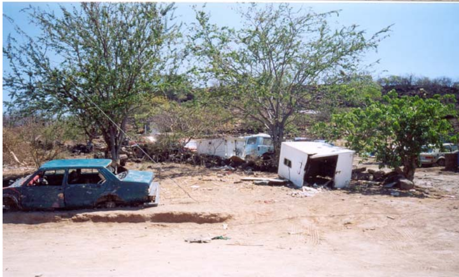
La Coronilla. Zona arqueológica. (frente del CAI)