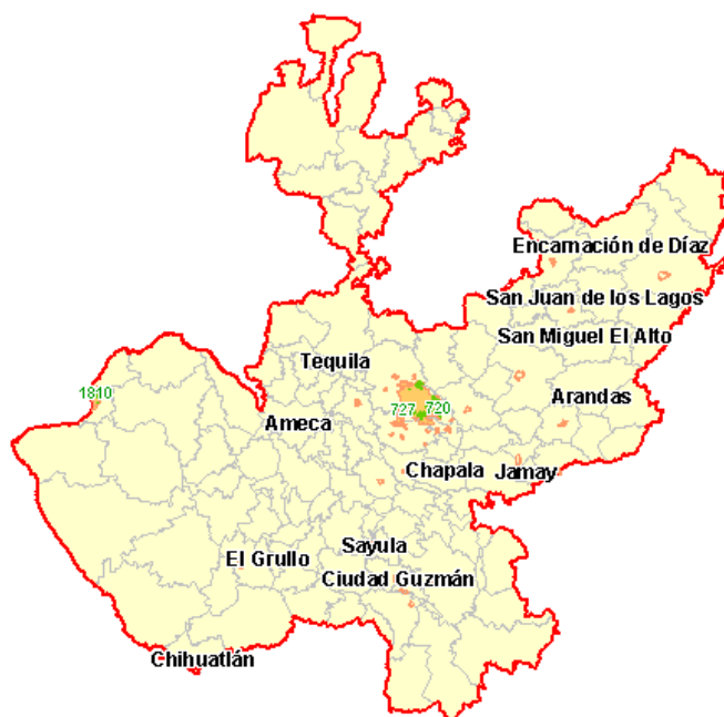
Mapa de las zonas de influencia de Hábitat.

En este mapa se pueden observar las zonas que Sedesol consideró en el año 2003, como de atención prioritarias del Programa Hábitat. Las manchas representan las zonas en las que se desarrolló la intervención gubernamental para mejorar los barrios y colonias urbano marginadas.