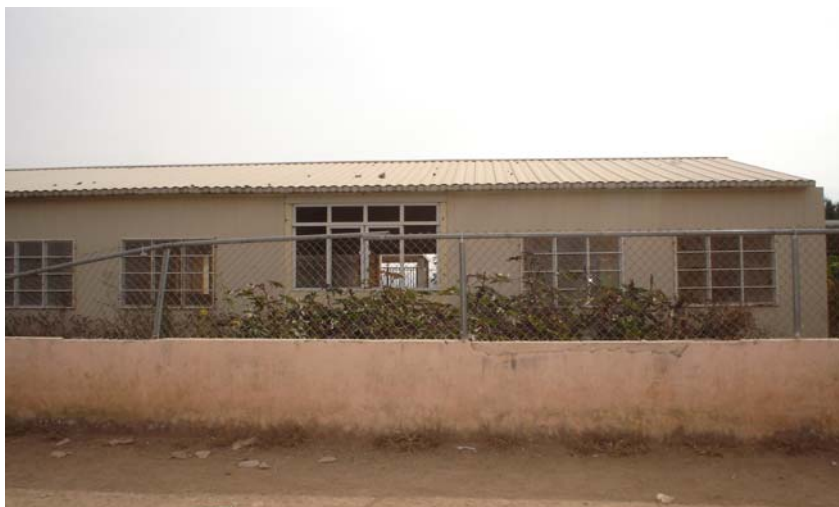
CAIC de la colonia Lomas del Cuatro.

En Tlaquepaque las construcciones de los centros infantiles son de material plafón y techos de lámina, como también se muestra en la fotografía, mientras que en Zapopan son de material block y techos de bóveda, quizá por ello, la diferencia en la inversión.