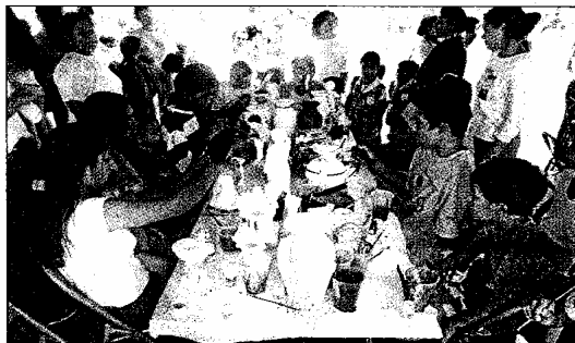
La falta de apoyos para organismos civiles fue el principal problema para la funcionalidad de los CAI.

La funcionaria de Zapopan añadió que la falta de recaudación en los organismos civiles se debe en parte a que atraviesan por una situación crítica debido a las condiciones del país.