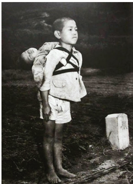
Fotografía acreditada a Joe O'Donnell, Japón, 1945.