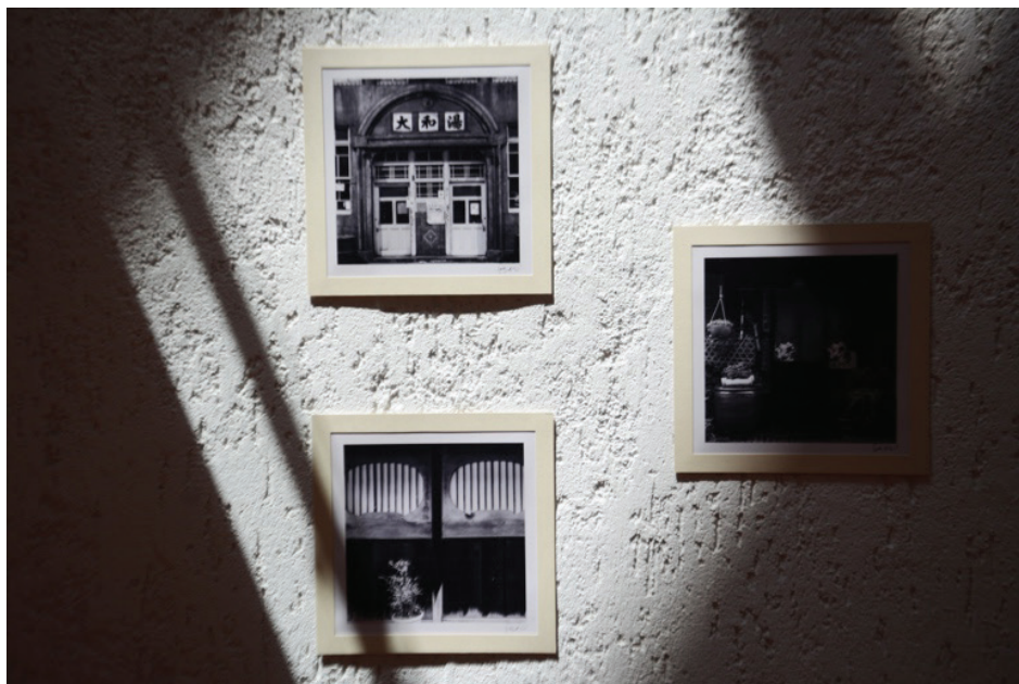
Panorámica de la exposición Hiroshima en El Colegio de San Luis, A. C., 2022.