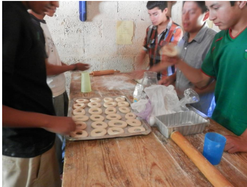
Figura no. 12. Alumnos en el taller de panadería donde realizan pan integral, galletas y dulces. Noviembre 2014, autoría propia.