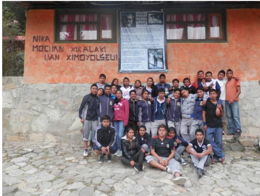
Figura no. 13. El grupo de estudiantes del bachillerato que residían en el internado durante la realización del trabajo de campo. Noviembre 2014.

Además en una experiencia como el bachillerato-internado de Tepexoxuca, que intencionadamente busca ofrecer más espacio para que los alumnos/as se organicen, tengan iniciativas para crear actividades y trabajen en conjunto a través de talleres y roles rotativos de coordinación, el papel del alumnado y su relación entre ellos/as cobra un gran peso. En conjunto a las diferentes influencias familiares y estructurales, la vivencia escolar particular de este bachillerato y las relaciones que se crean entre pares, son elementos constituyentes también del proceso identitario que estos jóvenes experimentan.