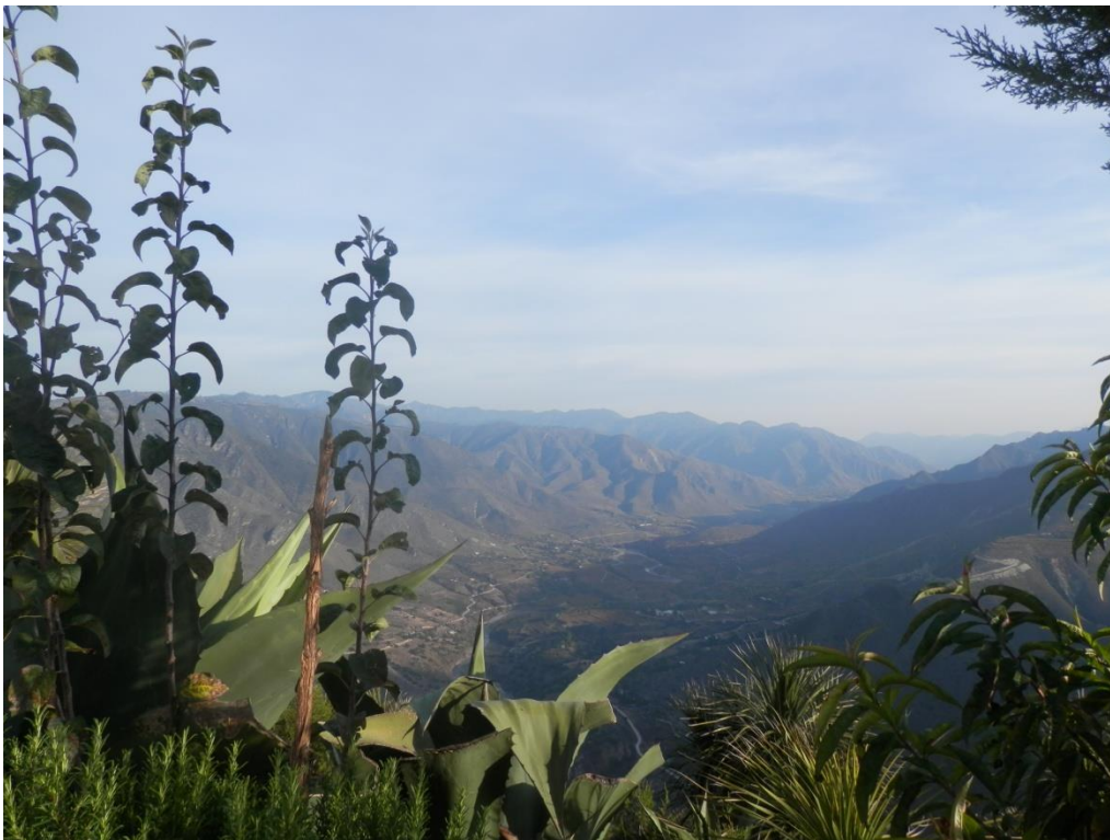
Figura no. 6. Vista de la sierra desde Tepexoxuca. Noviembre 2014, autoría propia.

fenómenos y corrientes ideológicas, expuestas en el anterior capítulo, además de la incidencia que tuvieron (y todavía tienen) diferentes movimientos de educación campesina e indígena en Latinoamérica (como el Movimiento de los Trabajadores Rurales Sin Tierra de Brasil -MST- o las escuelas del Consejo Regional Indígena del Cauca de Colombia –CRIC-). El objetivo de este capítulo era mostrar un panorama histórico de la región de la Sierra Norte de Puebla, previo a la formación de las TVC, para así en el siguiente capítulo presentar a través de una de las figuras simbólicas del proyecto, la del maestro Gabriel Salom, la trayectoria de la red objeto de estudio, además del modelo pedagógico que llevan a cabo en el bachillerato de Tepexoxuca.