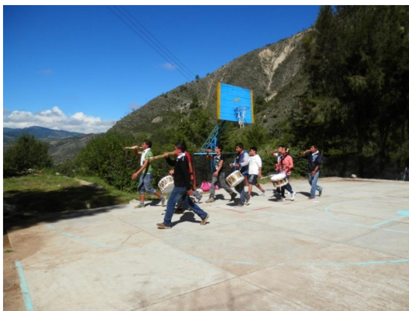
Figura no. 10. Alumnos ensayando para la celebración de la Independencia Mexicana (15 de septiembre). Septiembre 2014, autoría propia.

Los alumnos/as que no son de Tepexoxuca residen en el internado de lunes a viernes, volviendo a sus hogares el fin de semana. De los 61 alumnos/as inscritos en el bachillerato, 27 de estos alumnos/as residen en las comunidades aledañas (Tepexoxuca, Tenextepecuaco y Las Barrancas) y 34 alumnos/as residen en el internado. De esos 34 alumnos/as, 4 de ellos son del Estado de Guerrero y los demás son de distintos lugares del Estado de Puebla. Del total de los 61 alumnos/as, 22 son mujeres (10 de las cuales residen en el internado) y 39 son hombres (de los cuales 24 residen en el internado). Además, en el internado se hospedan 4 alumnos de la secundaria porque sus hermanos mayores acuden al bachillerato.