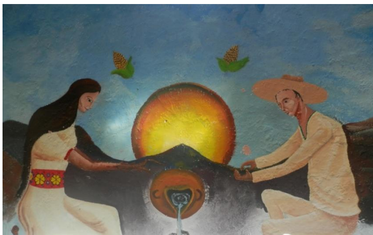
Figura no. 4. Mural realizado por los alumnos/as de la licenciatura del CESDER. Octubre 2014, autoría propia.

En esta investigación se irán mostrando la capacidad de agencia de los miembros de esta red, al crear lazos con otras organizaciones, instituciones y personas, además de sus estrategias en relación al Estado. Pero, en ese largo camino de treinta años de labor educativa de la red, también han sido influenciados y transformados por elementos externos a la red, como las políticas gubernamentales en materia de educación, las corrientes ideológicas y teóricas mostradas en este capítulo, o el contexto local e histórico que se mostrará a continuación.