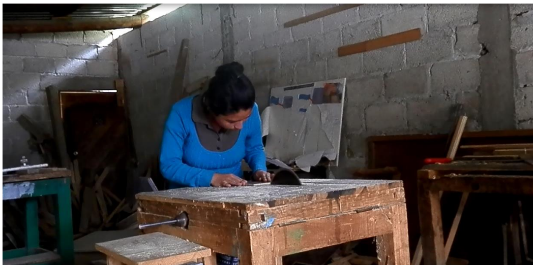
Figurano. 11. Alumna en el taller de carpintería donde realizan marcos para fotografías, utensilios de cocina de madera y pequeños muebles. Noviembre 2014.

Demetrio. Alumno del bachillerato en el taller de conservas. 19 noviembre 2014. Tepexoxuca).