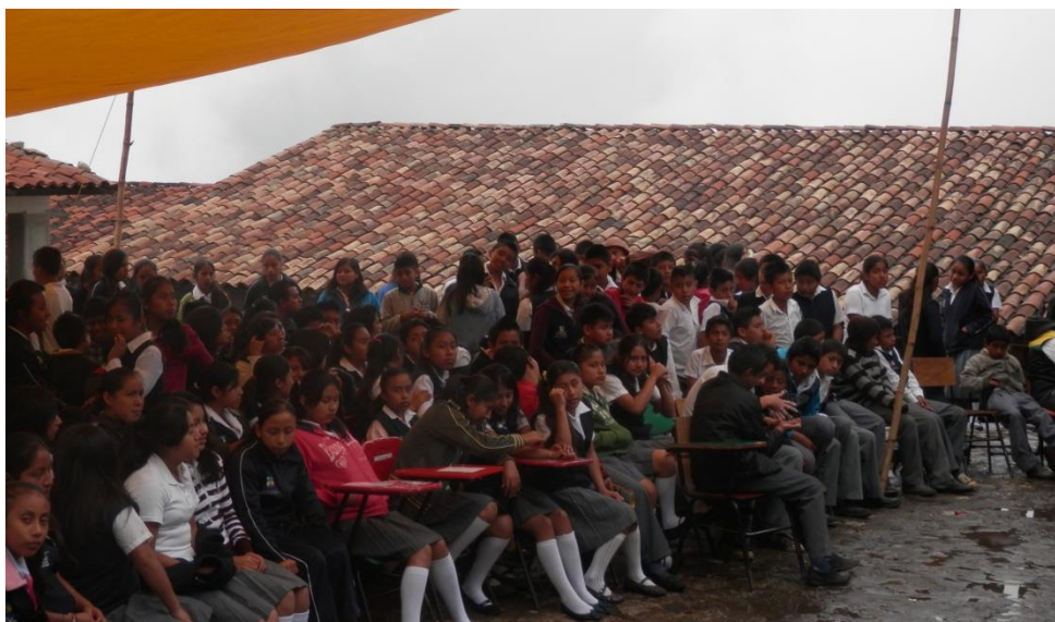
Figura no. 5. Alumnos y alumnas de la Telesecundaria Tetsijtsilin durante una Feria de la Ciencia. En pequeños grupos mostraban experimentos científicos realizados por ellos mismos. Diciembre 2014.

los talleres son variados, a la vez que mantienen un vínculo con los conocimientos locales o habilidades de las personas del mismo lugar. En algunos casos acuden ex-alumnos/as de la telesecundaria a dar los talleres, tanto personas mayores (como el actual maestro del taller de bambú) como chicos/as jóvenes (como los que ahora imparten el taller de comunicación social y radio). Además, no sólo se busca este anclaje con lo local a través de los talleres, sino que también a través de las clases se busca retomar los conocimientos locales, y que aquello que aprendan no esté desvinculado del mundo rural donde habitan, pero sin dejar de lado aspectos más globales de la educación.