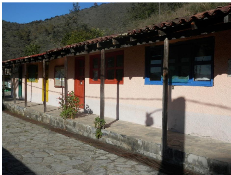
Figura no. 14. Instalaciones y oficinas del CESDER. Octubre 2014.

Con todas estas influencias crean en 1985 la licenciatura en Planeación en Desarrollo Rural, de tipo modular, semi-presencial y reforzada por esos conocimientos que habían intercambiado con otros proyectos y ONGs. Los primeros años, para ayudar a impartir la licenciatura invitan a maestros/as de otras ONGs o de universidades, como la Universidad Autónoma Chapingo (UACH) y los centros de investigación que en aquel tiempo estaban surgiendo (como el Instituto Mexicano del Maíz creado en 1979). Conseguían que estos investigadores/as y maestros/as conocieran el proyecto y poco a poco, ellos mismos iban informando e invitando a otros maestros/as a impartir clases y así se iba divulgando esa experiencia educativa en diferentes entornos.