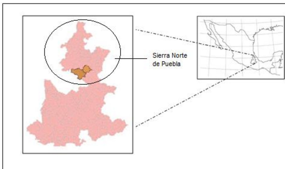
Figura no. 1. Estado de Puebla. Municipios de Ixtacamaxtitlán y Zautla.

El trabajo de campo se realizó en los municipios de Ixtacamaxtitlán y Zautla, en la región de la Sierra Norte de Puebla, Estado de Puebla, México (véase figura no. 1).