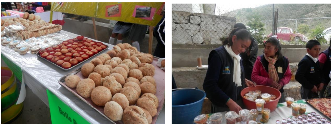
Figura no. 15. Alumnas vendiendo los productos que realizan en los talleres productivos durante la Feria de la Ciencia (que organizan entre las trece TVC). Noviembre 2014.

La mayoría de los maestros/as de las TVC está de acuerdo con la nueva reforma porque facilita el trabajo que llevan realizando durante años. Por ejemplo, a partir de este cambio, ahora el Premio de Maestro Distinguido a nivel estatal que otorga la SEP, va dirigido hacia el maestro/a que consiga tener “la mejor” actividad productiva y a sus alumnos/as comprometidos en la organización de la escuela. Antes de la reforma, este tipo de premios iban dirigidos hacia los maestros/as con más diplomas o más méritos académicos.