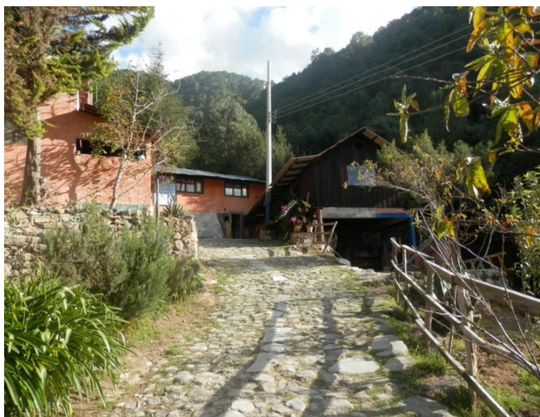
Figura no. 9. El internado-bachillerato de San Andrés Tepexoxuca. Octubre 2014, autoría propia.