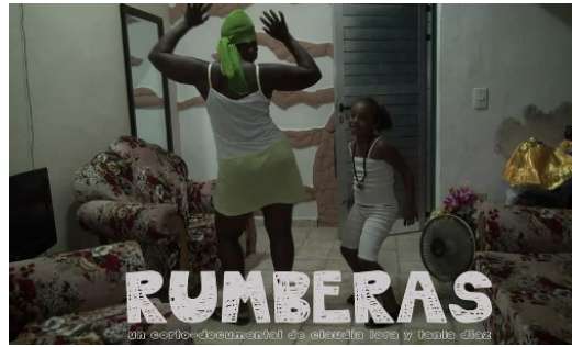
Imagen 2 Póster del cortometraje Rumberas . Diseño: Tania Diaz.

La memoria incorporada en la danza y conservada y transmitida por mujeres se propaga también en espacios rituales. El proceso de enseñanza femenina es vital porque, además de transmitir conocimiento y memoria corporal, muestra un sentido de identidad familiar y comunitario.