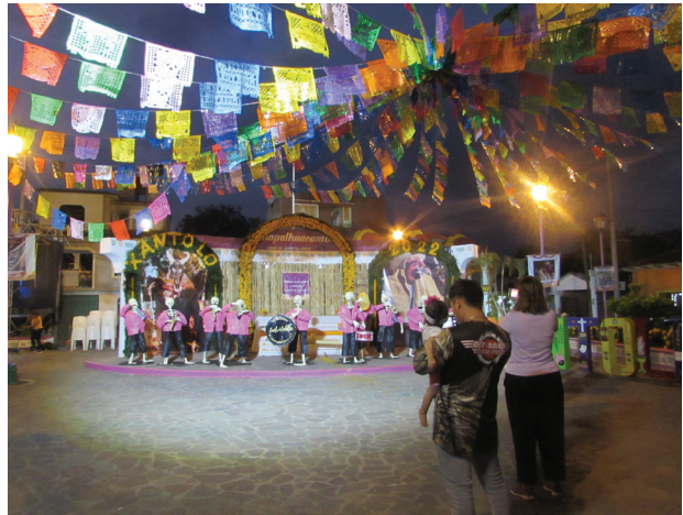
Imagen 1 Chapulhuacanito: lugar de chapulines y de máscaras. Chapulhuacanito, Tamazunchale, S.L.P. México. Noviembre de 2022

rolla una serie de creencias y prácticas (López Austin, 1994: 12). Como lo define Amparo Sevilla, el Xantolo “son días en los que se abre un tiempo sagrado para la celebración de la vida y la muerte” (2002: 6).