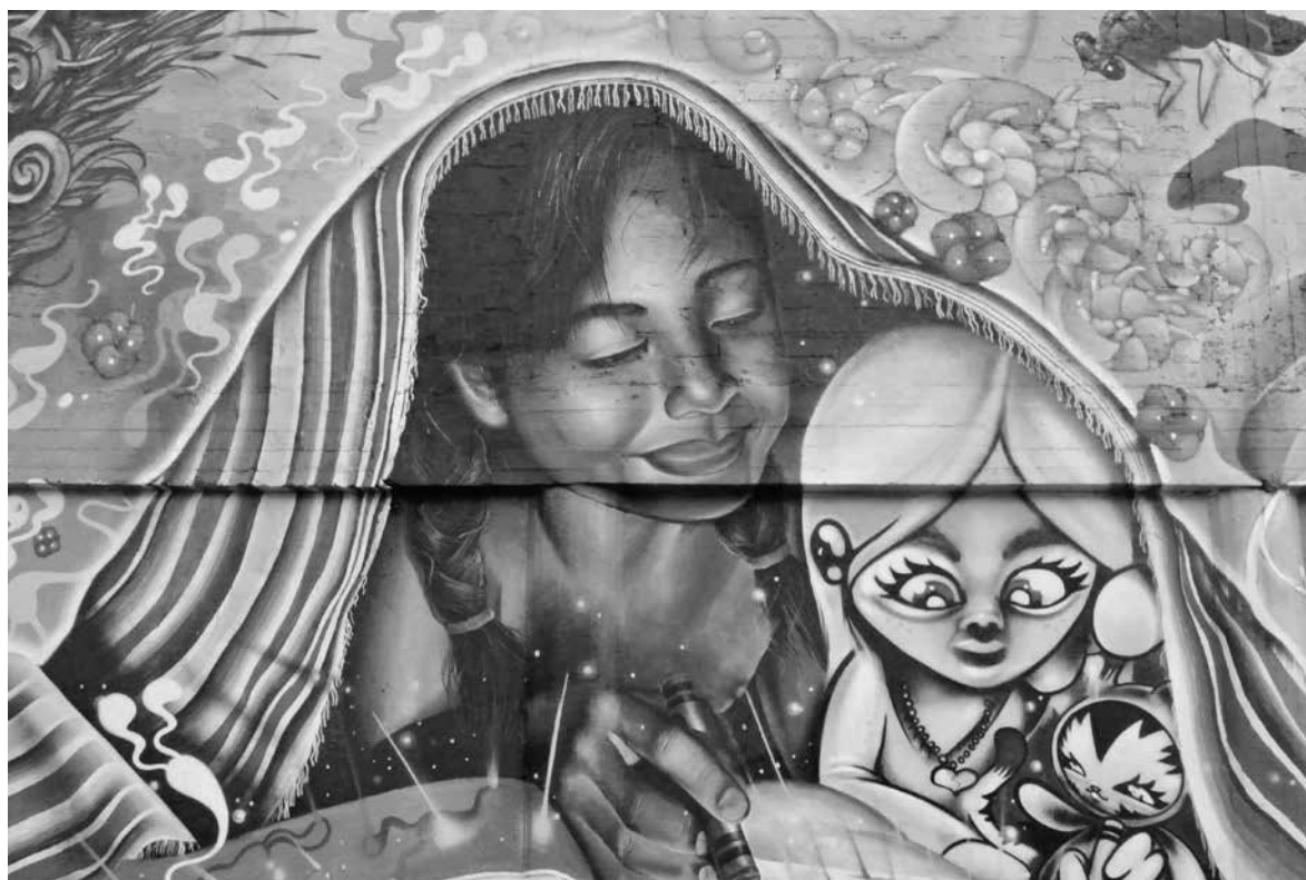
ROZENN LE MÛR ▶ Fragmento de un mural realizado por los artistas mestizos del proyecto Honghikuri, Guadalajara, Jalisco, 2014.

Estas discordias se incrementan con la falta de consideración de los códigos culturales que pueden llegar a ser muy diferentes. Muchas observaciones registradas en el trabajo de campo muestran una falta de comunicación profunda entre los huicholes y los mestizos, aunque no sea reconocida. Mi experiencia personal como extranjera en México me ha mostrado que la diferencia de códigos culturales entre distintas sociedades puede ser muy marcada. Por ejemplo, mi