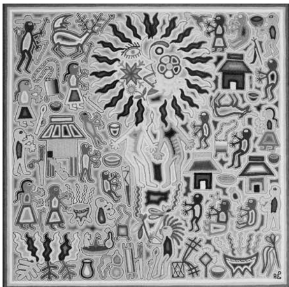
ROZENN LE MÛR ▶ Cuadro de estambre. Antonio López Pinedo, "Eclipse en el mundo huichol", Guadalajara, Jalisco, 2011.

es adulto, otro protegible. La etiqueta de vulnerabilidad, como la de pobreza, atenta contra la acción política. La desigualdad discursiva en el espacio público no favorece el arreglo político. La vulnerabilidad impide lo político en la relación entre los distintos y a los indígenas los vuelve objeto de eterna vigilancia y atención (2010: 18).