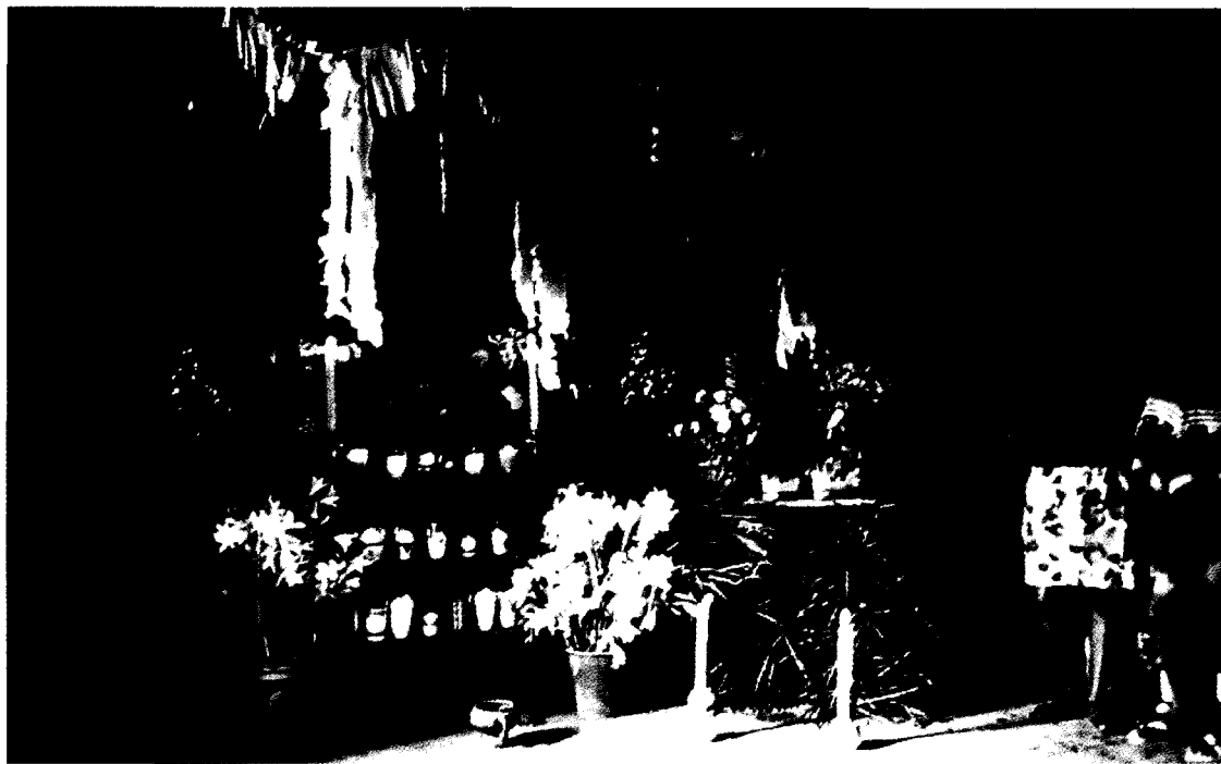
Ocosocuautla, Chiapas; Agustín Estrada