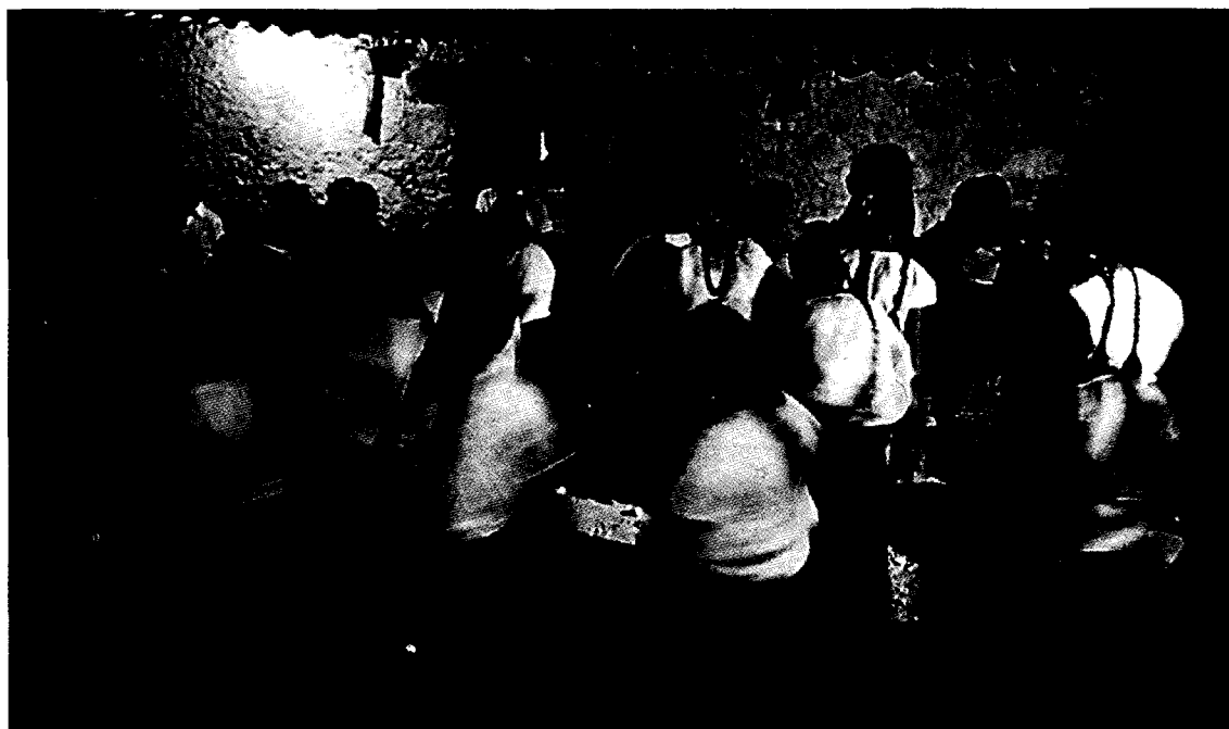
Zitlala, Guerrero; Agustín Estrada