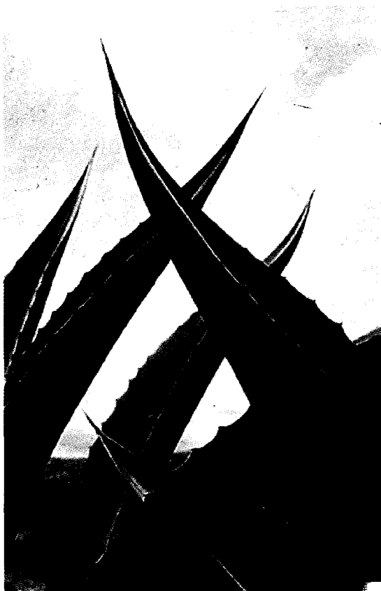
Valle del Mezquital, Hidalgo; Agustín Estrada