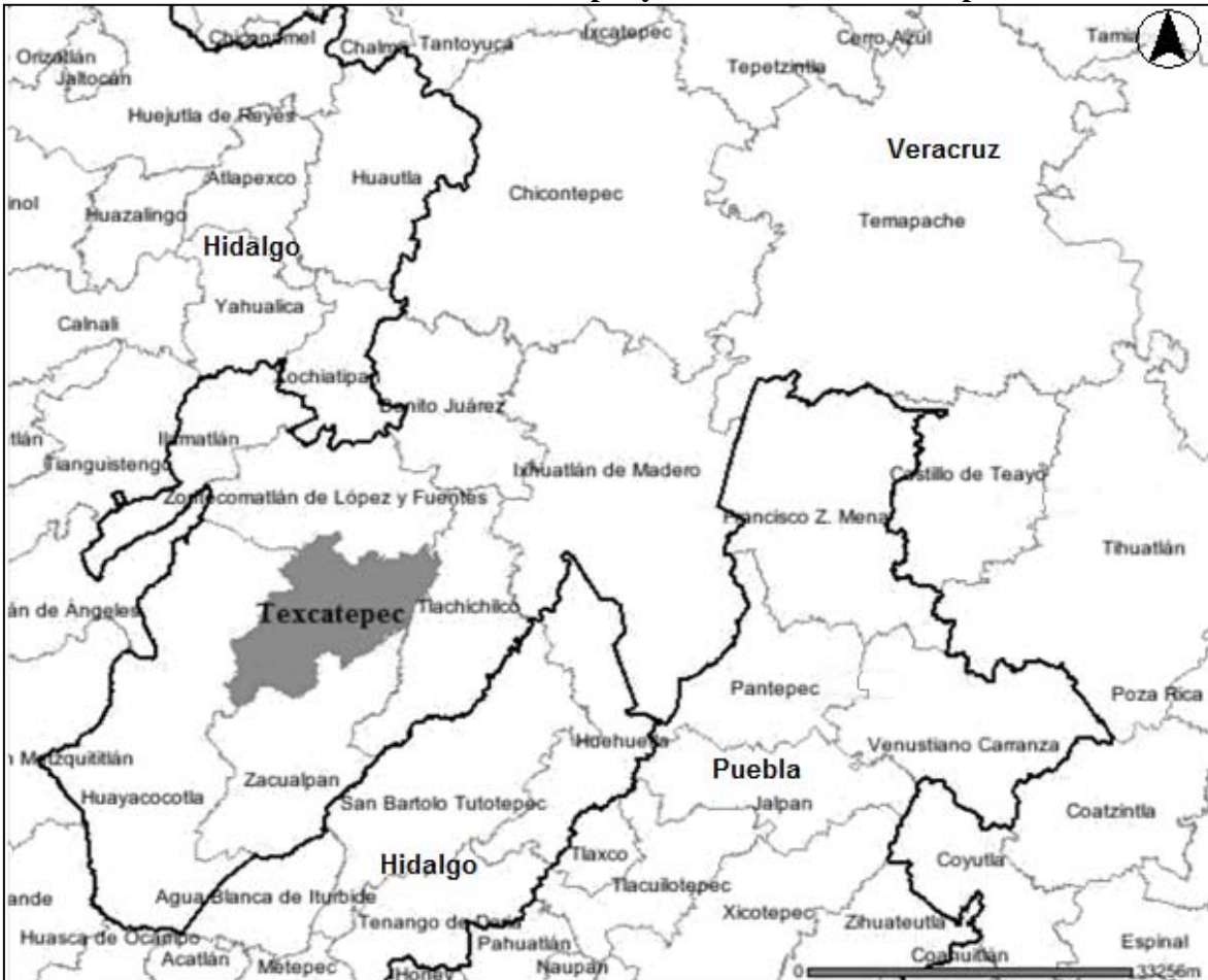
Ilustración 2. Localización de Texcatepec y colindancia con municipios vecinos