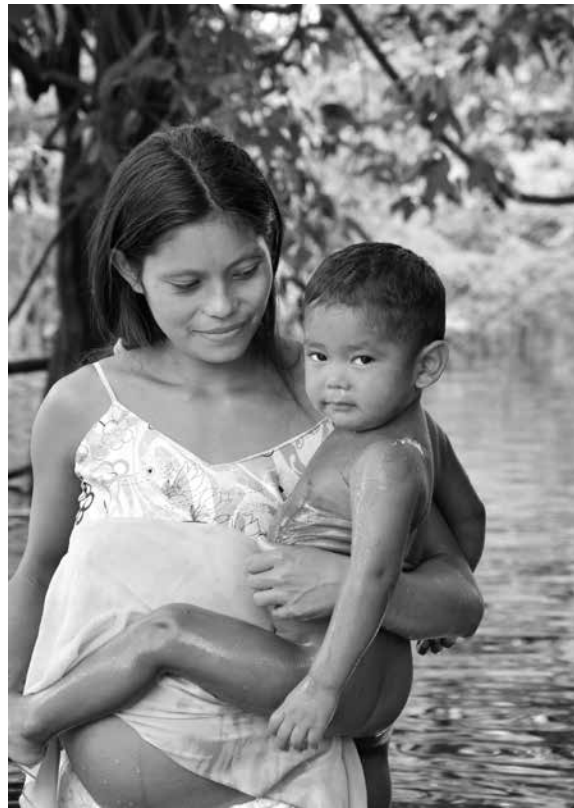
DANIEL SCOPEL ▶ Gestante munduruku en la orilla del río Canumã, después de bañar a su hijo menor. Aldeia Kwatá, abril de 2011.

Aunque sólo dos de las mujeres identificadas como parteras hubieran tomado un curso de capacitación, las cinco señaladas tenían legitimidad social para actuar como parteras por ser poseedoras del don para agarrar la barriga, halar la madre del cuerpo, atender partos y recetar baños, rezos e