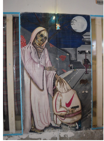
Mural a la Santa Muerte en un pasillo dentro del CEVARESO.

del santo; esta actividad es una forma de resistencia al control carcelario, puesto que esos espacios se diseñaron originalmente para colocar pertenencias personales, como la ropa, y los internos se los apropian con sus creencias y prácticas religiosas.