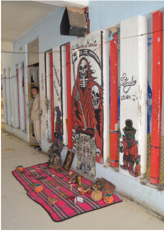
Altar a la Santa Muerte dentro de un pasillo en el CEVARESO.