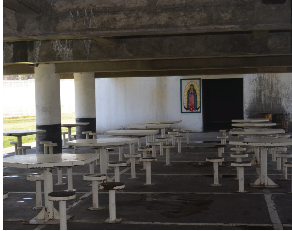
Comedor en una zona del CEVARESO.

las celdas se puede corroborar cuál interno tiene dinero y cuál no, ya que algunas tienen televisiones, colchones, repisas; es decir que aunque los espacios están pensados y diseñados para determinada forma de convivencia, los internos hacen sus propios ajustes y dejan marcada su identidad.