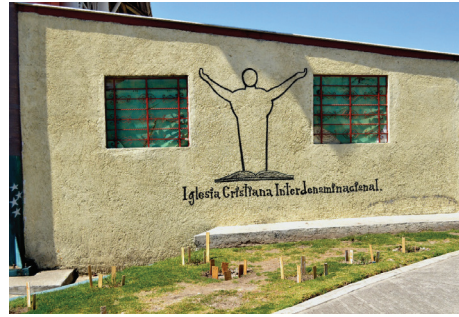
Capilla interdenominacional dentro del CEVARESO.

para practicar el culto a la Santa Muerte o al diablo y la santería son las celdas y los pasillos, espacios cuyo acceso no es público y se mantienen ocultos a la vista de los familiares y de otras autoridades. Es una forma de encubrir dentro de la prisión este tipo de religiosidades, que son parte de un estigma negativo pues se consideran que son propias de internos que no han cambiado su conducta delictiva.