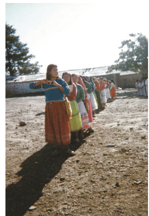
“Son alumnas de la secundaria junto con las de la primaria formadas para hacer un desfile”. (1997) Carlos Salvador